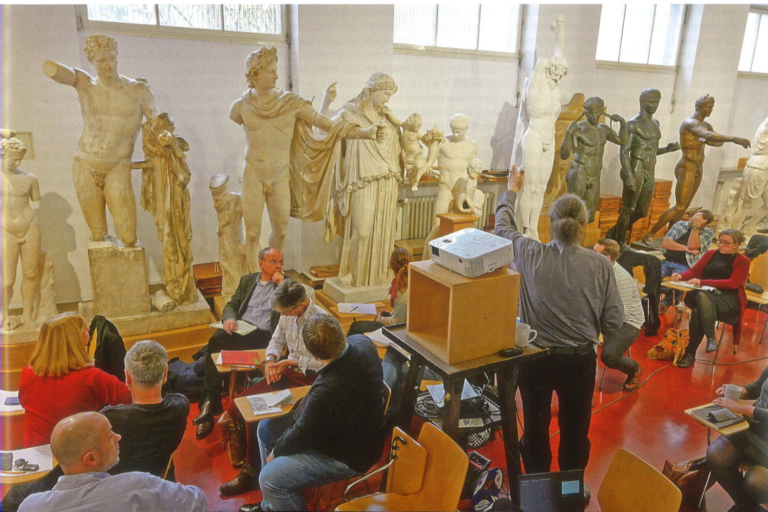
Abb. 1 Vortrag inmitten der Antikensammlung der Universität Erlangen-Nürnberg