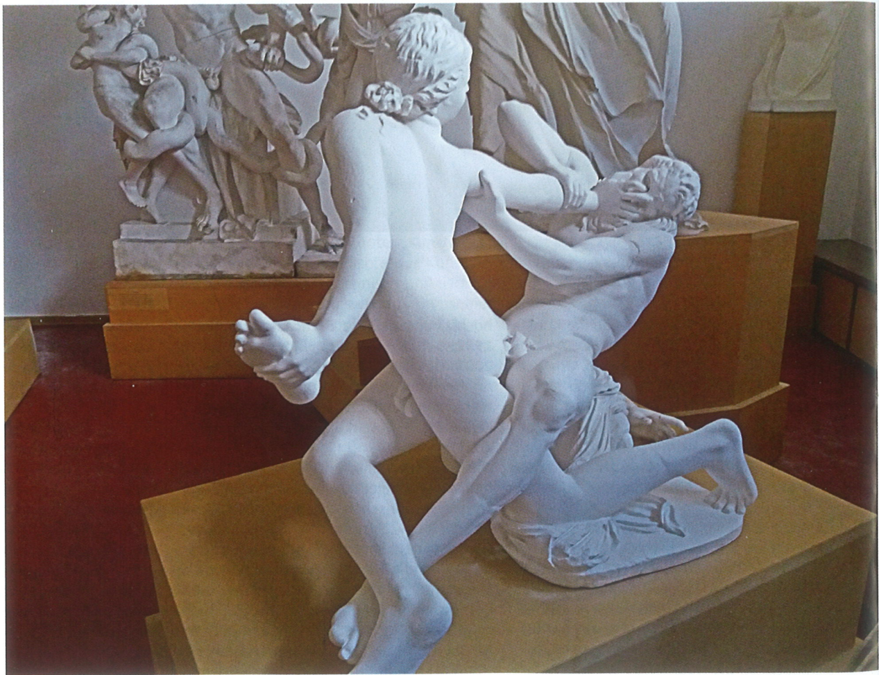
Abb. 4 Oberflächenberührungen – ein Thema der von Ovid inspirierten spätantiken Skulptur

der menschlichen Empfindung und Wahrnehmung. Dieses „Wohl-tuende“ des angenehmen, gesunden Erlebens (Terpsis) ist die Wirkung der richtigen Anwendung eines angemessenen Regelwerkes (vgl. hierzu auch Sowa et al. 2017, S. 20–34). Die „Symmetrie“ und „Eurythmie“ aller Glieder – vom kleinsten zum Großen aufsteigend und bis in die letzten Feinheiten des Inkarnats (von der Dicke eines Daumennagels) sich darstellend (vgl. grundlegend: Beck et al. 1990, Schirren/Koch 1999) – gestalten ein Ganzes, das letztlich eine Gestalt gewordene Form der Weisheit (Sophia) ist. In der Essenz zeigte der Vortrag von Nadia J. Koch auf, wie diese im 5. Jh. v. Chr. entwickelte „Weisheit“ der Symmetria sich – in verschiedenen Wandlungen – bis in den neuzeitlichen Klassizismus tradiert hat.