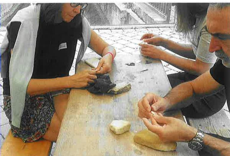
Abb. 4 Workshop von Barbara Spreer (Urgeschichtliches Museum Blaubeuren) zur Elfenbeinbearbeitung