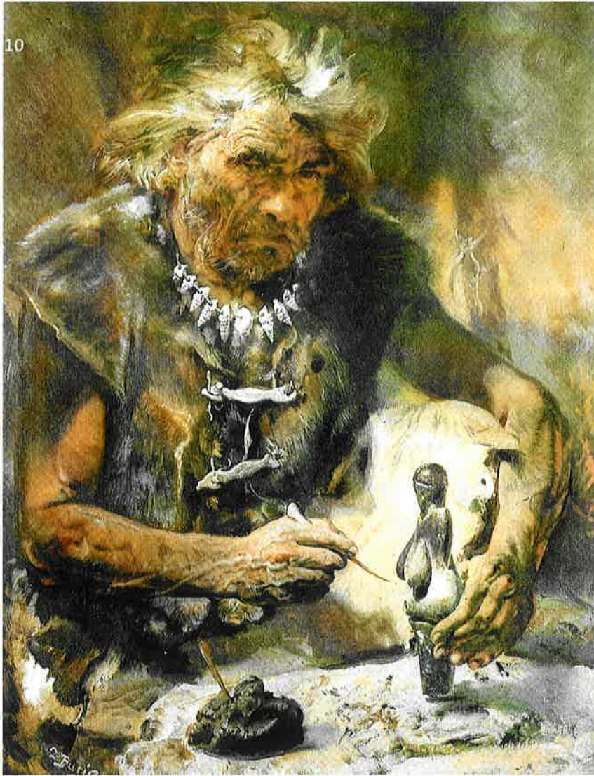
Abb. 1 Zdenek Burian: Anfertigung der Venus von Dolni Vestonice. Abbildung aus: Burian, Zdenek/Wolf, Josef: Menschen der Urzeit. Die Entwicklung des Menschen von den ersten Anfängen an. Prag 1977, S. 143. (Archiv Barbara Spreer, Blaubeuren)