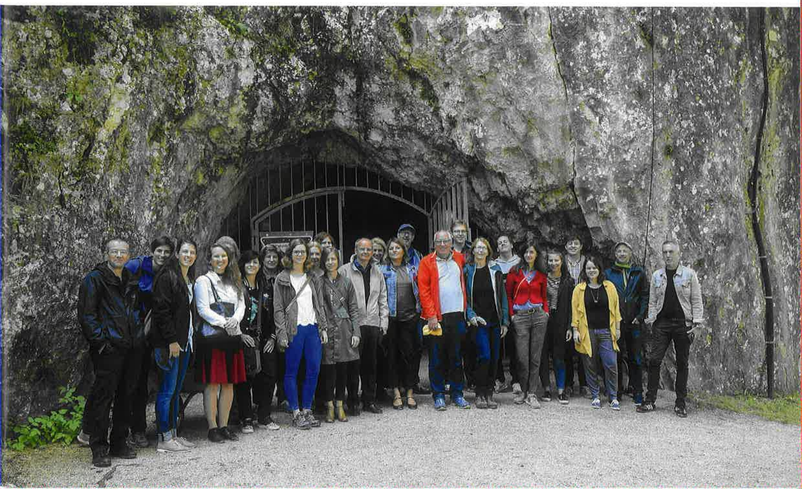
Abb. 2 Kongressteilnehmende des Forschungsverbundes IMAGO vor der Hohlefeldhöhle

Genau in dieser komplexen Problemlage zeigt sich die Schwierigkeit, den „Anfang“ der Kunst exakt zu „datieren“: Gibt es wirklich einen datierbaren qualitativen Sprung zwischen dem Kontinuum bildhafter Werkzeugherstellung, bildhafter Überhöhung von Werkstücken (etwa durch Ornamentierung und Dekorierung) und skulptural-bildhafter und graphischen Darstellung von Tieren und Menschen, die sich von zweckhaften Nutzungszusammenhängen abscheiden und einer neue Umgangsform mit Artefakten zuzuordnen sind, nämlich jener symbolisch-rituellen Betrachtung, die sich den Figuren und dem Flötenspiel zuwendet? Ist das wirklich ein „epochales“, neues Werkverhältnis, in dem sich der primäre Zweck der „Gemeinschaftsbildung“ in den Vordergrund